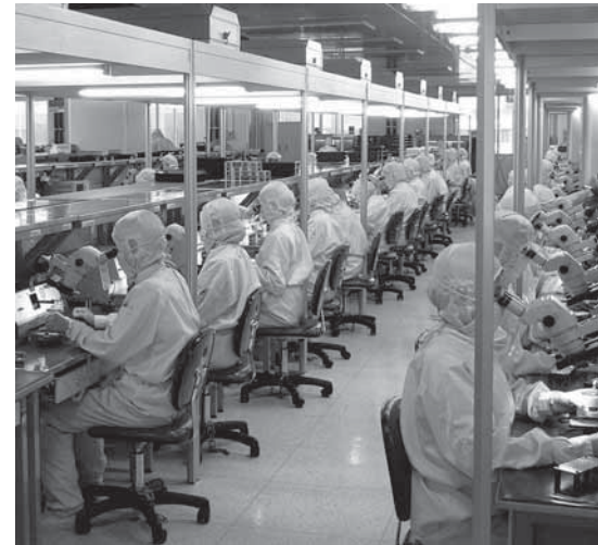
PharmazeutInnen auf der Suche nach ewigem Leben

Im vierten Semester beschäftigen wir uns mit Instrumenteller Analytik, hier bestrahlen wir Substanzen mit Lichtquanten. Was sich vielversprechend für unsere Suche nach dem ewigen Leben anhört, endet im gleichen Semester bei der Mikrobiolo-