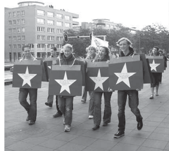
Aktion in der Maastrichter Innenstadt

Doch beim Day of Europe wurde nicht nur geredet. Am Samstag griffen die TeilnehmerInnen zu den Bastelutensilien, um sich kurze Zeit später in Eu-