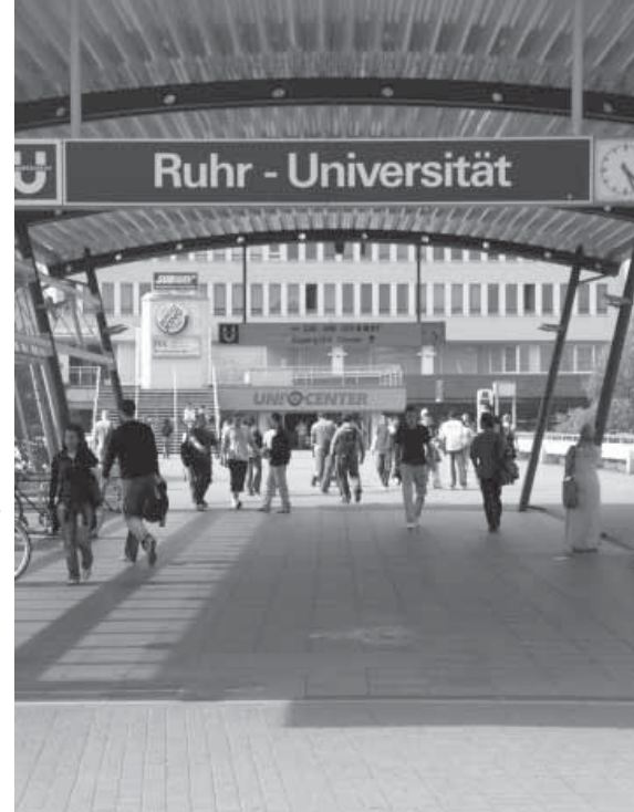
Ruhr- Universität in Bochum

Zeche Zollverein: Weltkulturerbe in Essen