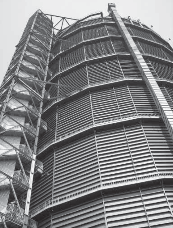
Das Gasometer Oberhausen

2. Wenn das Ruhrgebiet in früheren Zeiten der Stahlstandort Deutschlands Nummer eins gewesen ist, so war Essen sicherlich ihr Zentrum. Eine Deutschlandweit bekannte Stahlfirma hat hier ihren Ursprung, bis heute zeugen noch Zahlreiche Monumente und Baudenkmäler vom treibenden Motor dieser Stadt. Auch die am Naherholungsgebiet Baldeneysee gelegene Villa Hügel zeigt dem Betrachter Reichtum dieser einen Familie. Macht ein Foto von dem im Garten der Villa Hügel stehenden Löwen und findet raus, wie diese Familie hieß, die der Firma zugleich ihren Namen gab (jeweils 15 Punkte).