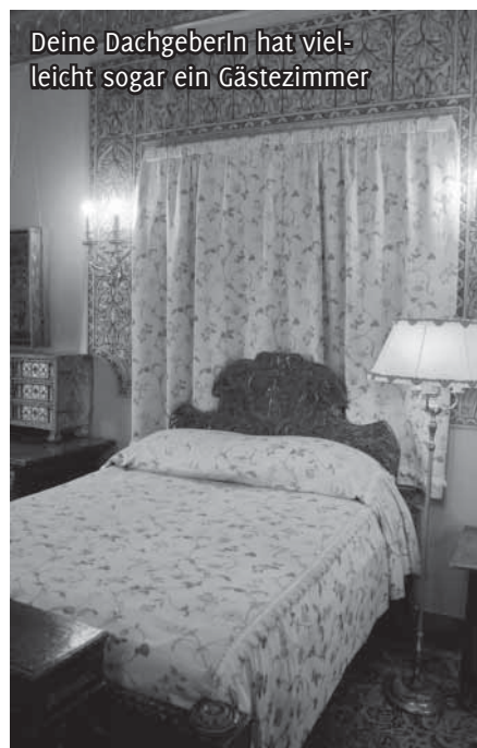
Deine DachgeberIn hat vielleicht sogar ein Gästezimmer

=> wiki.gruene-jugend.de/index.php/Zimmer-Pool