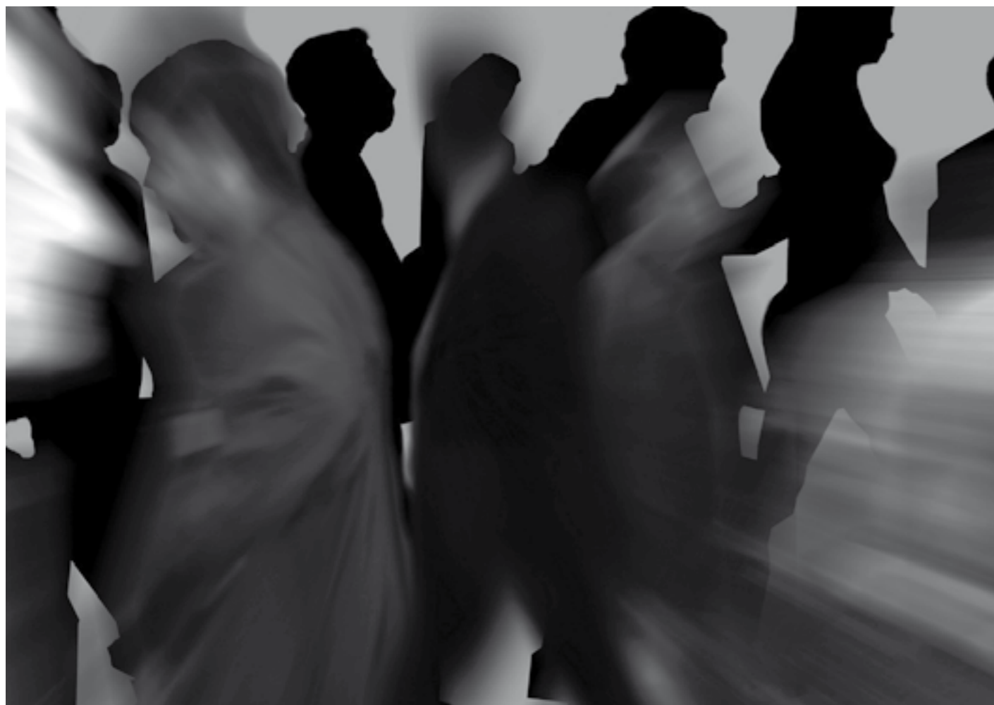
Hetze, Eile, Stress. Inzwischen Normalität.

Letztendlich hängt es von jedem selbst, seinem Anspruch an sich, seinen Zielen und dem eigenen Ehrgeiz ab, wie viel Stress wir uns machen und wie viel Stress wir uns machen lassen. Jedoch sollten wir uns fragen, ob wir unseren Kindern einmal schon in der Kindheit Stress als Dauerzustand antun wollen. Manchmal stimmt es eben doch: Früher war es besser.