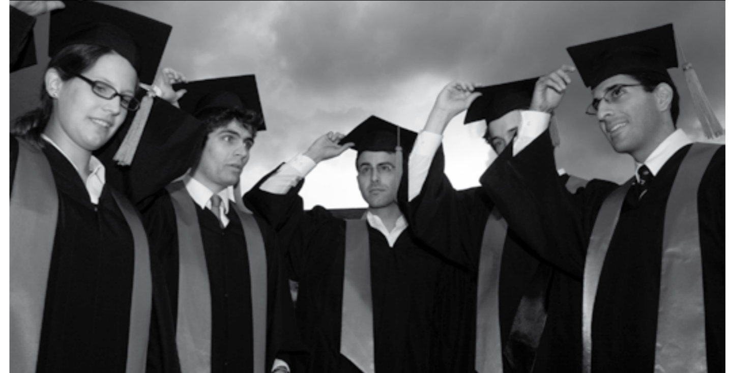
Ob diese Bonner Absolventen zukünftig Elite sein werden?