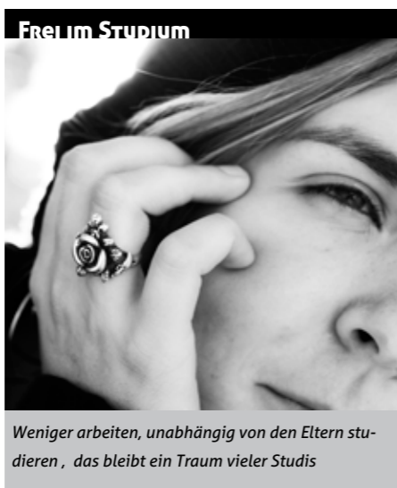
Weniger arbeiten, unabhängig von den Eltern studieren, das bleibt ein Traum vieler Studis

Hat die Reform wenigstens ihr Ziel, einen Einheitlichen Hochschulraum zu schaffen, erreicht? Wohl kaum. Die Mobilität der Studierenden geht zurück, die Zahl der Erasmussemester sinkt. Viele wollen oder können sich nicht mehr erlauben, ein Semester länger zu studie-