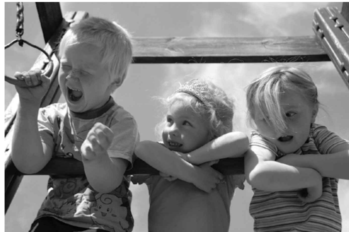
Schreiende Ungerechtigkeit: Nicht alle Kinder haben wen zum Spielen

W erden Kitas zu Kaderschmieden der Gesellschaft? Oft wird die Verankerung eines Bildungsanspruchs in der Kita in dieser Weise missverstanden. Keine Kita soll zur Schule für die Kleinsten verkommen. Es gilt aber, schon früh die Lust am Lernen zu wecken, um einen optimalen Start ins Bildungssystem zu ermöglichen. Kinder müssen weiterhin im Mittelpunkt stehen. Ihr Interesse an der Welt, in der sie leben, soll erhalten und gefördert werden. Mehr darf von Kinderbildung nicht erwartet werden.