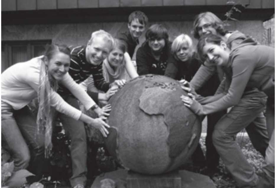
Der frischgewählte Landesvorstand am 08. November 2009 auf der LMV in Dortmund

:>KRASS Alex, was sind die drei wichtigsten Gegenstände in deiner Küche?