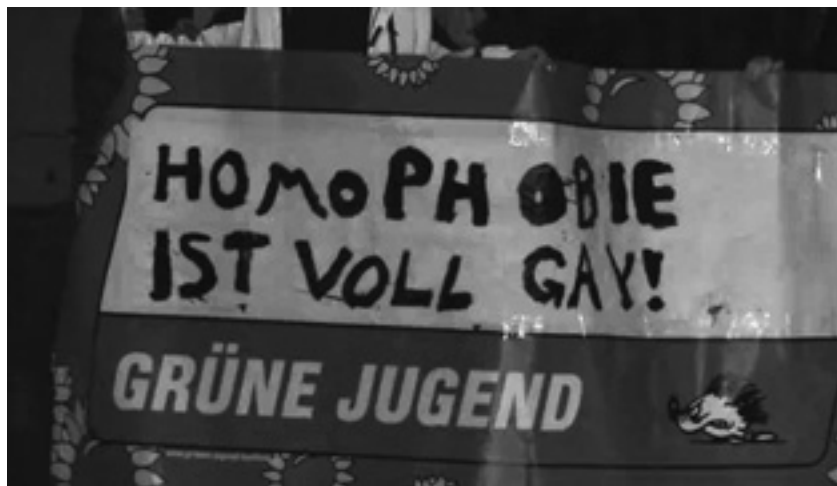
Die Grüne Jugend war natürlich mit dabei!

Die komplette Dokumentation kann man sich im Internet ansehen: