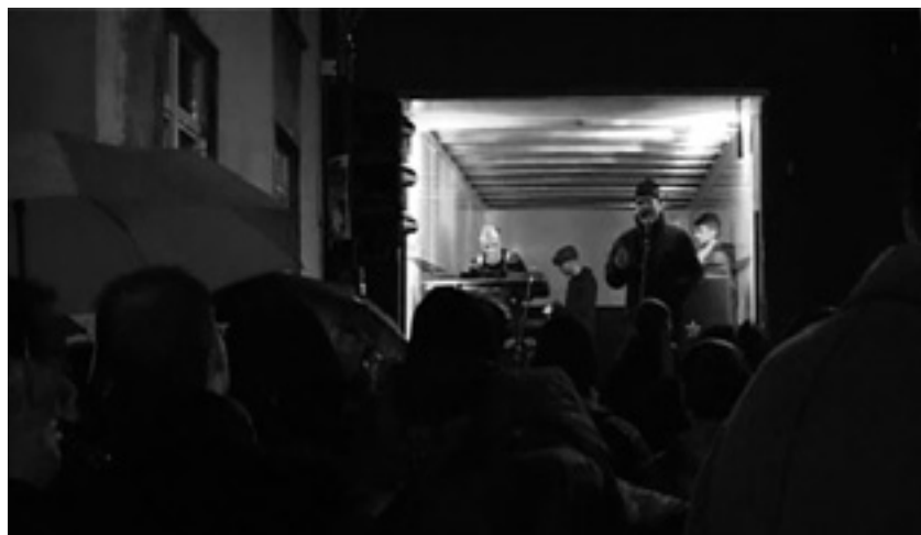
Ein LKW umfunktioniert zur Bühne bat Demonstranten und Besuchern ein Alternativprogramm