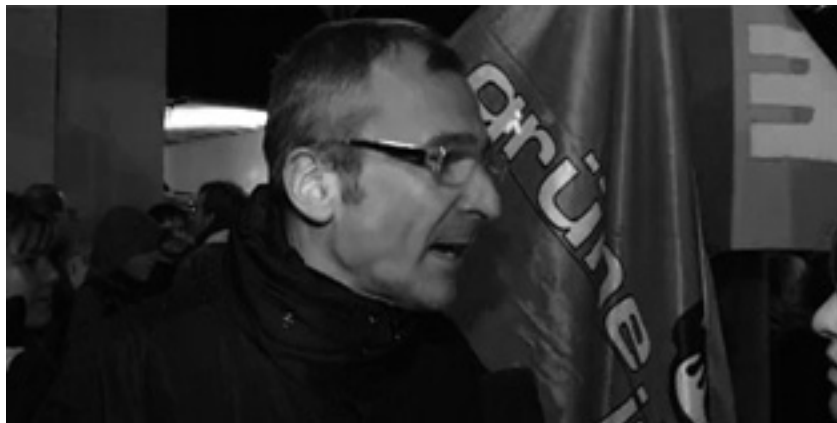
Volker Beck unterstütze die Proteste

Ob diese Demonstration das Konzert hätte verhindern können oder sich Konzertbesucher umentschieden haben wissen wir nicht. Jedenfalls waren sich die meisten einig: Es ist jedenfalls wichtig, unsere Gesellschaft auf diese Thematik aufmerksam zu machen.